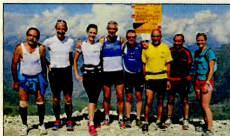
Die Läufer posieren vor dem Wegweiser

Die über 80 Teilnehmer waren vom Lauferlebnis in Arosa begeistert und freuen sich auf die nächsten Arosa-Lauftage im nächsten Jahr. So kann bereits heute gesagt werden, dass der grosse Erfolg der Lauftage 2013 im nächsten Sommer wiederholt werden soll. Dann bestimmt mit noch mehr Teilnehmerinnen und Teilnehmern und sehr wahrscheinlich gar mit einer Öffnung für weitere Laufsportvereine der ganzen Schweiz.