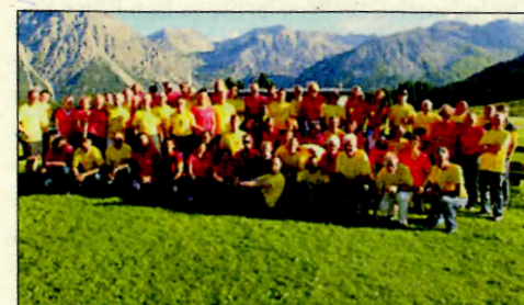
Gruppenfoto der begeisterten Läufer.